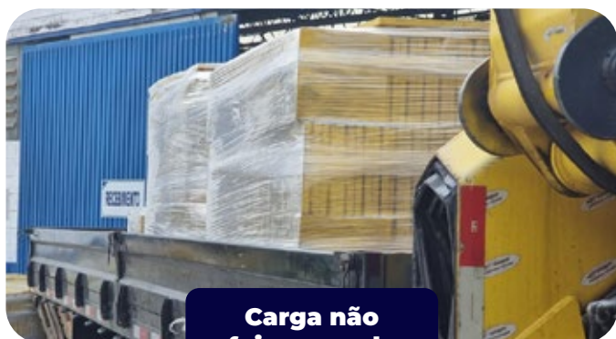
Carga não foi amarrada corretamente