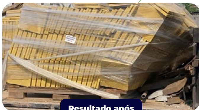
Resultado após freada brusca

A correta manipulação dos pisos táteis de concreto durante o descarregamento, armazenamento e transporte é crucial para manter sua qualidade e funcionalidade. Siga rigorosamente as orientações deste manual para garantir que os pisos cheguem ao destino final em perfeitas condições, prontos para serem instalados e cumprirem seu papel na promoção da acessibilidade e segurança urbana.